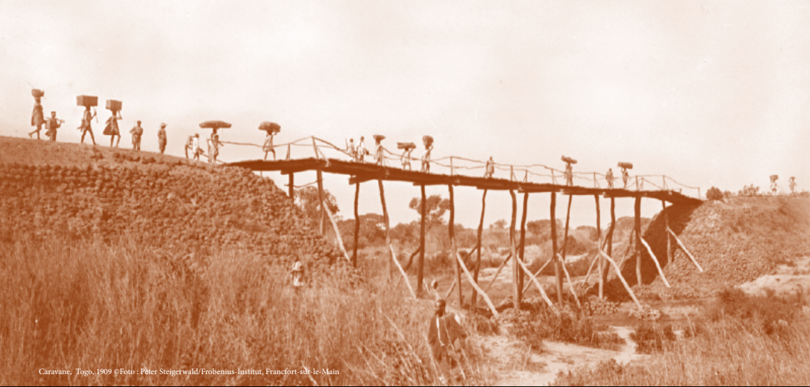
Caravane, Togo, 1909

dans la construction et la réappropriation d'un savoir ethnologique